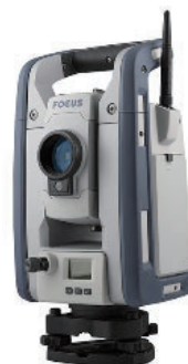
Spectra Geospatial Focus 50